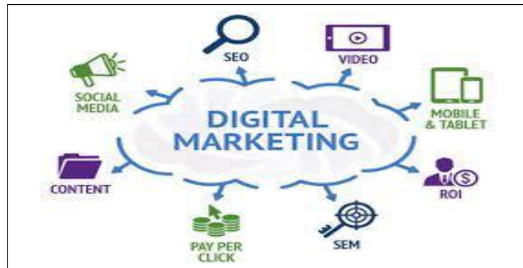
Gambar3. Digital Marketing

menyebutkan bahwa komoditas fashion merupakan komoditas dengan nilai transaksi paling tinggi dan diprediksi akan mencapai angka transaksi sebesar US$ 11.9 miliar pada tahun 2023.